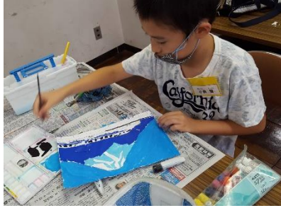
色紙ちぎり絵・手作り写真立て作り