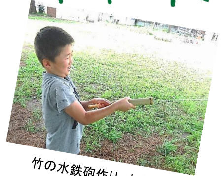
竹の水鉄砲作り・水遊び