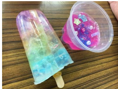
手作り石鹸とオリジナル小物入れ作り