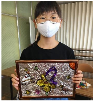
スタンドグラス風写真立て作り