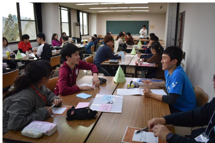
『北東部ユース・リーダーズ・アクト 2020』③ 子どもの豊かな体験を主題とした学生たちのディスカッションの様子