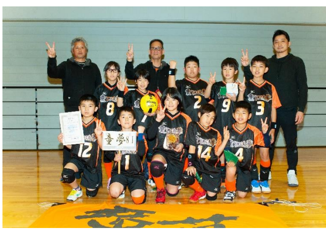
ジュニアの部 優勝 京都YMCA 童夢8さん