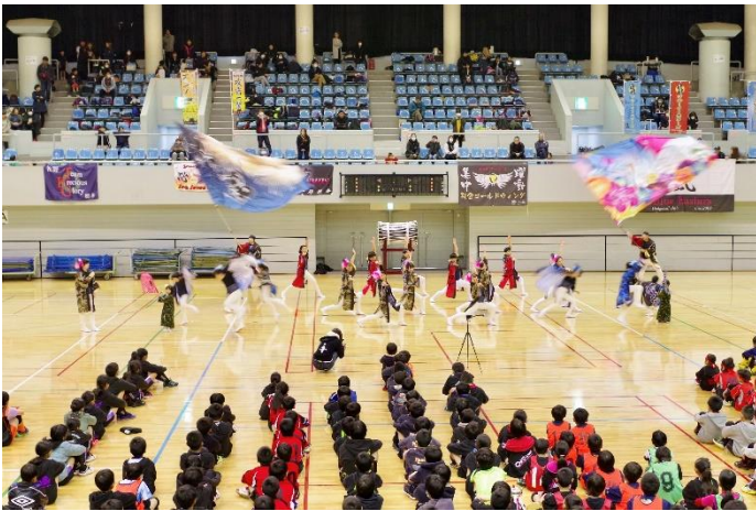
開会式オープニング（よさこい披露）の様子