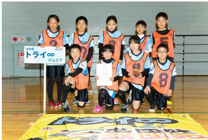
ジュニアの部 第3位 トライ∞ジュニアさん