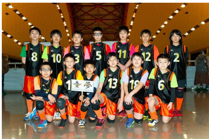
YMCA 友好招待チーム：京都 YMCA 童夢さん