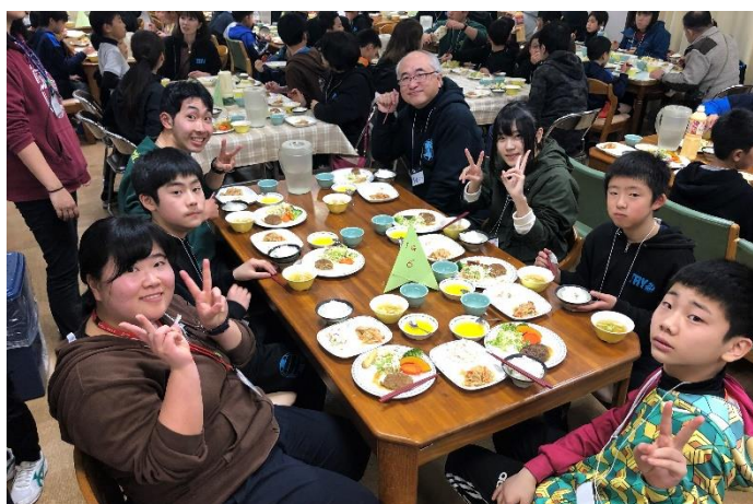
『北東部ユース・リーダーズ・アクト 2020』④ とちぎ・盛岡・京都から集まった参加者の親睦を深めた夕食会の様子