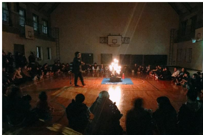
『北東部ユース・リーダーズ・アクト 2020』⑤ 皆で火を囲んだキャンドルファイヤーの様子