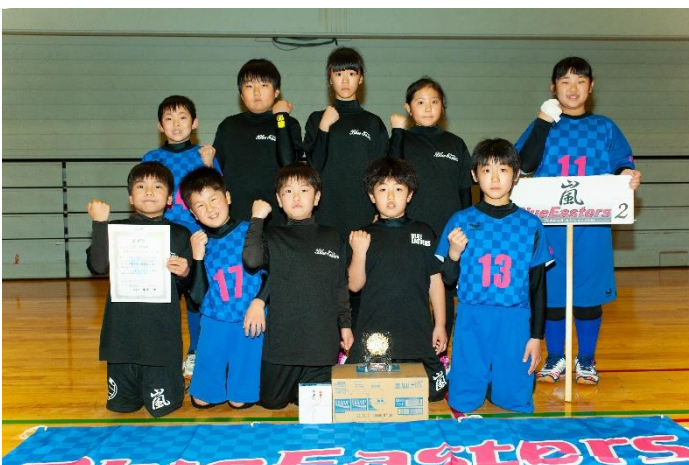
ジュニアの部 準優勝 ブルーイスターズ Jrさん