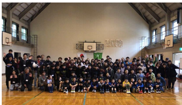
併催イベント『北東部ユース・リーダーズ・アクト 2020』① 主催：ワイズメンズクラブ国際協会東日本区北東部・とちぎ YMCA