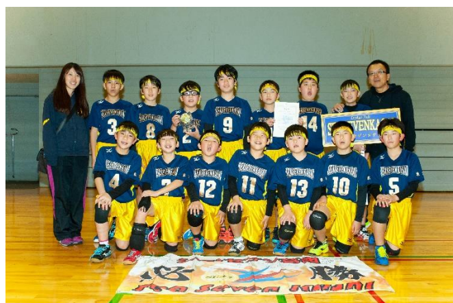
男女混合の部 準優勝 Sea Seven Kasai さん