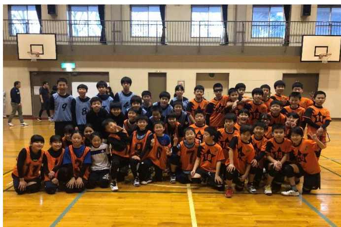
『北東部ユース・リーダーズ・アクト 2020』② トライ∞（とちぎ YMCA）と京都 YMCA 童夢との交流試合の様子