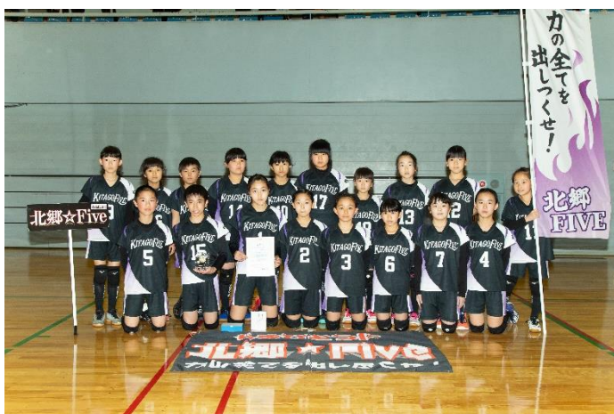
男女混合の部 第三位 北郷☆Five さん