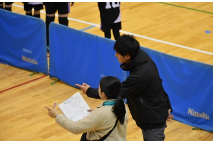
YMCA ユースボランティアリーダーによる大会運営